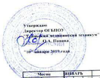
ГРАФИК УЧЕБНОГО ПРОЦЕССА НА ВТОРОЕ ПОЛУГОДИЕ 2018-2019 УЧЕБНОГО ГОДА