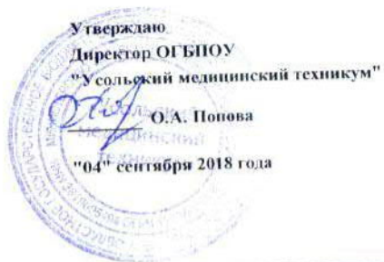
ГРАФИК УЧЕБНОГО ПРОЦЕССА НА ПЕРВОЕ ПОЛУГОДИЕ 2018-2019 УЧЕБНОГО ГОДА