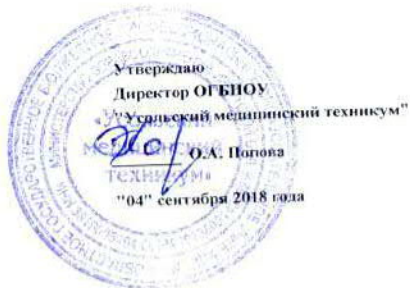
ГРАФИК УЧЕБНОГО ПРОЦЕССА НА ПЕРВОЕ ПОЛУГОДИЕ 2018-2019 УЧЕБНОГО ГОДА